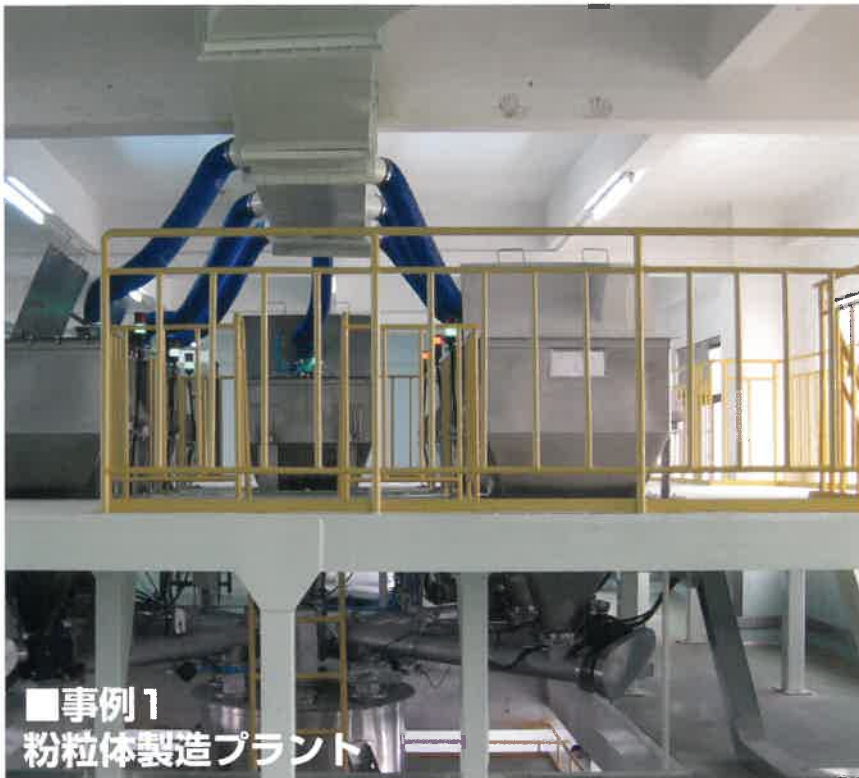
■事例1 粉粒体製造プラント