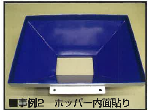
■事例2 ホッパー内面貼り